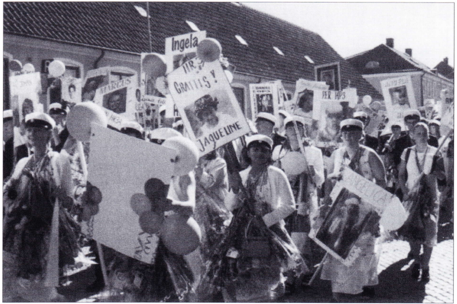
Studentereksamen fejres i Simmershavn. Er disse unge indstillet på et regionalt samarbejde over Øresund? Projektets succes afhænger af dem.

Kommunikationsstrukturen for både mennesker og vareudveksling understøtter her projekt Øresund med lufthavne, jernbaner og omladepladser. IT-strukturen er ligeledes veludbygget, og både det sociale miljø, den fysiske planlægning og boligområdernes standard (inklusive udbygningen af Ørestaden på Sjællands-siden) er af høj klasse. Det europæiske fastland ligger ikke langt borte med Storberlin og Hamburg som Øre-