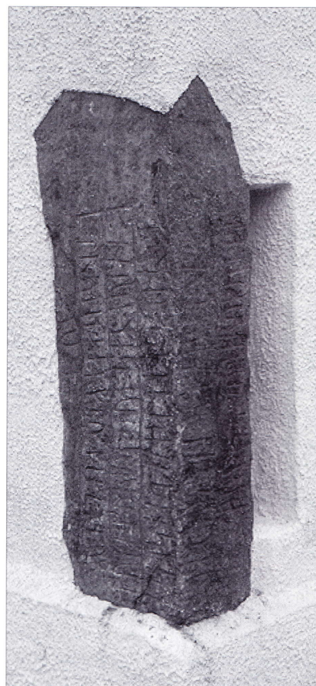
Hellested I.

ÆGIDIUS, JENS PETER: (oversætter): Knytlingesaga. Knud den Store, Knud den Hellige, deres Mand, deres Slagt . København 1977.