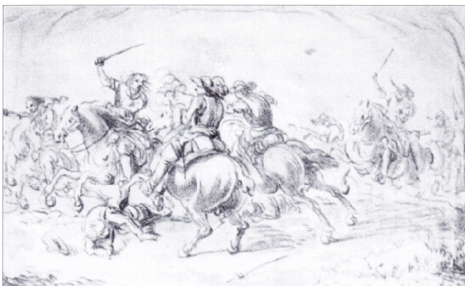
Ryttere i strid. Samtidig tegning i J. F. Lemkes skitsebog.

Sörensson skriver, at friskytterne udgjorde et meget betydeligt tilskud til den danske hær militære kraft, en hær der ved invasionen i 1676 talte 14.000 mand. Det typiske billede er, at kompagnierne var aktive i sommerhalvåret, men at de efter løvfald gik i vinterkvarter i de danske fæstninger (Landskrone, Helsingborg og Christiansstad) eller blev overført til Sjælland.